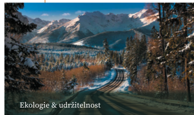
Ekologie & udržitelnost