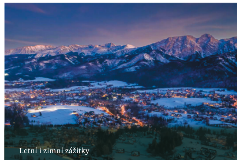
Letní i zimní zážitky