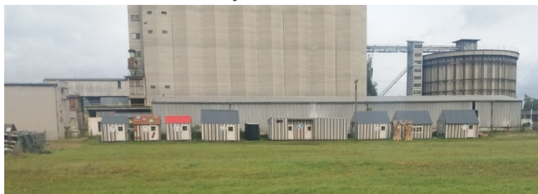
Obr. 1: Vizualizace části Zajištění